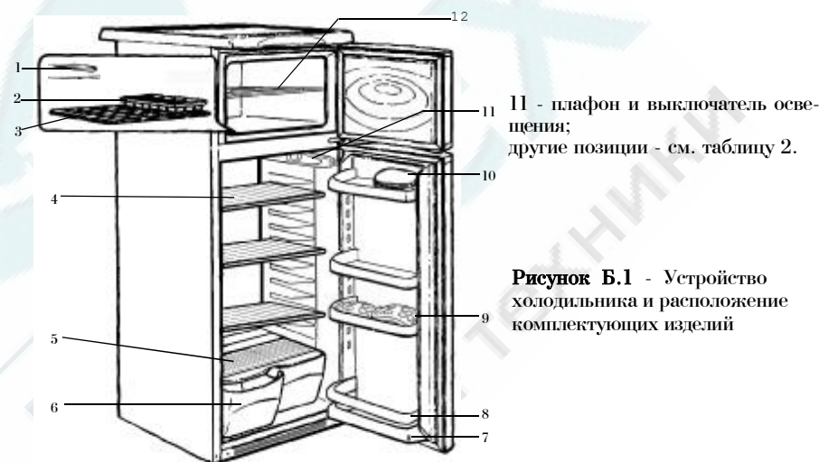
Рисунок Б.1 - Устройство холодильника и расположение комплектующих изделий